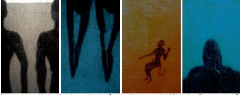
Voley playa. Natación sincronizada. Selección española. Nadador. De la serie "Olimpicas"