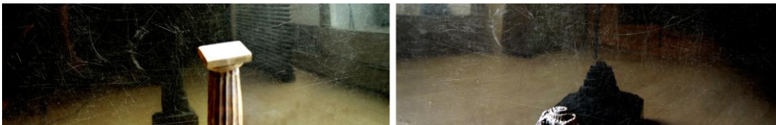
EE Tierra 8 Columna - EE Tierra 7 Babel. De la serie EE Estudio Español

Durante los primeros años del 2000 uno de sus proyectos fotográficos más intensos y significativos será sin duda "Aproximaciones" que aparecerá en forma de diario en su página web durante un número de años (del 2001 al 2006) para luego ser publicados en papel, en tres volúmenes distintos. En realidad se trata de tres experiencias correlativas, cada una de ellas compuestas por 366 imágenes fotográficas, 'aproximaciones' a su vida privada para una mejor comprensión de su obra por el 'navegante accidental'. Las primeras tendrán un formato horizontal, las segundas vertical y las terceras circulares aunque todas en blanco y negro y acompañadas de textos que ordenan su comprensión. Desde el 2005 llaman la atención los proyectos en base fotográfica que realiza en colaboración con otros artistas. Por un lado su encuentro con Ana Santos y Pedro J. Miguel ya desde 2003, responsables de múltiples ediciones de libros de artista desemboca en su participación con obras en base fotográfica en varios volúmenes de la serie Salamandria como "El Tren" o "El Círculo". Con posterioridad ilustra el libro de poemas de J.A. González Iglesias "Olímpicas" de El Gaviero Ediciones además de mantener con Ana S. durante todo un año (2004-2005) el proyecto 'Columnas' que aparecía los domingos en su página web.