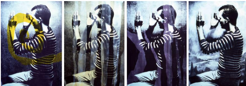
Collages realizados con el cartel "Mira también hacia lo lejos"

En 1975 monta su primer laboratorio fotográfico en Melilla ( con anterioridad había trabajado sobre todo en el de su tío Mario ) y casi de inmediato, en una nueva vuelta de tuerca, introduce en sus imágenes a lápiz y tinta, una clara sensibilidad fotográfica. Hay una determinante sujeción 'realista' en su forma de plasmar una idea y en repetidas ocasiones, los personajes aparecen en movimiento, haciendo referencia objetiva al medio fotográfico que le ha servido de trabajo preparatorio.