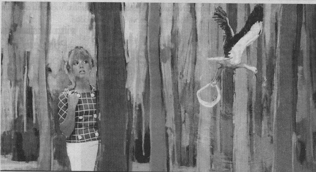
METAFÓRICA OBRA. La mujer se esconde de la cigüeña que lleva un bebé, interpretación pictórica de Hernández del término 'anticonceptivo'. JORGE HERNÁNDEZ