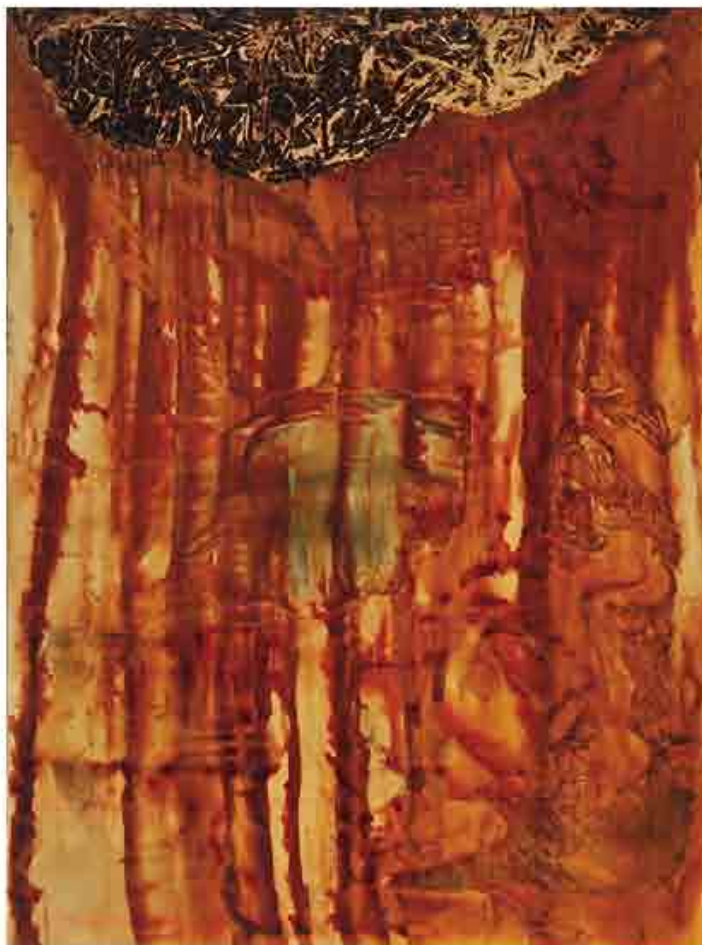
Lluvia petraea, 2000.

La gran exposició que es presenta ara al Carme de València, sota l'auipcil de la Generalitat Valenciana i la Xunta de Galícia, reuneix una selecció de les millors obres d'esta època. El visitant tindrà l'oportunitat d'accompanyar l'artista en el seu viatge intel·lectual cap al fons de la matèria i la naturalesa. Basso exposa regularment tant a Espanya com a l'estranger i la seua obra es troba representada en importants col·leccions en l'àmbit nacional i internacional.