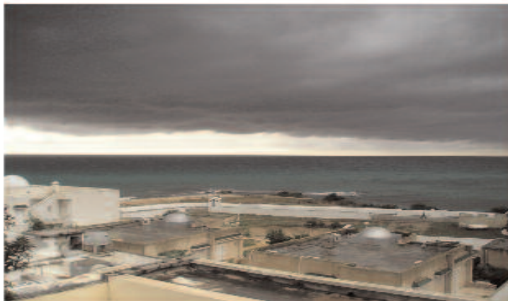
retrato bipolar fotografía digital 25 x 15 cm 2008 |5 copias|