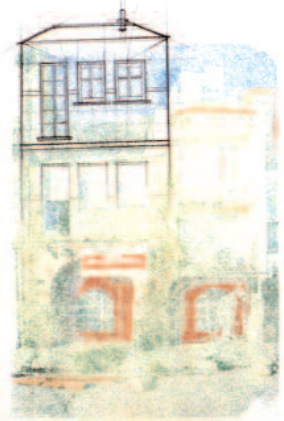
reconstruir sobre lo borrado I, II, III grafito y transferencia sobre papel 32 x 22 cm 2009 [pieza única]