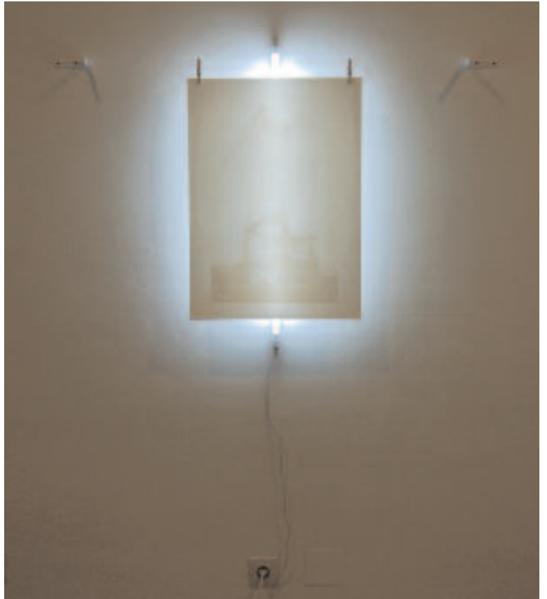
sin título (espacio borrado) instalación, fluorescente y serigrafía sobre papel / 2009 |pieza única|