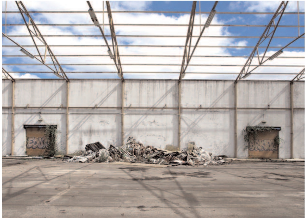
silencio de edificios fotografía lambda digital 17 x 23 cm 2009 [5 copias]