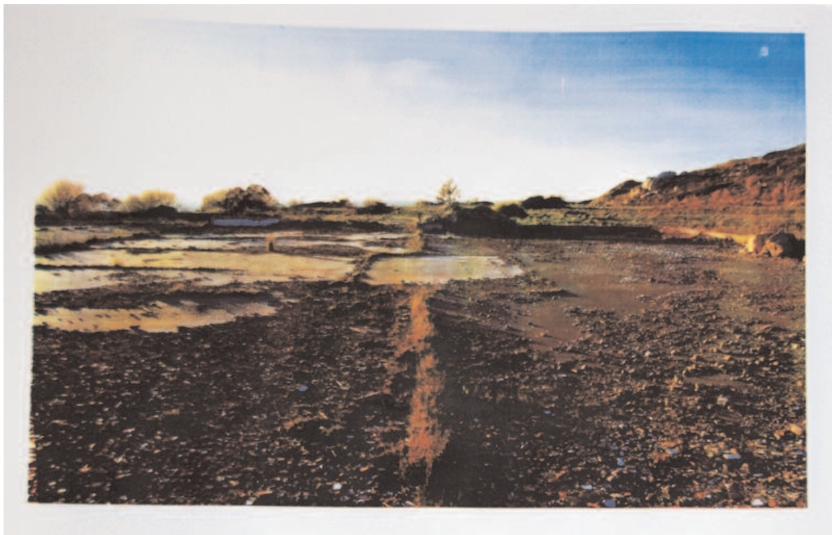
sin título (arquitectura latente) serigrafía sobre papel 40 x 60 cm 2009 |3 copias|