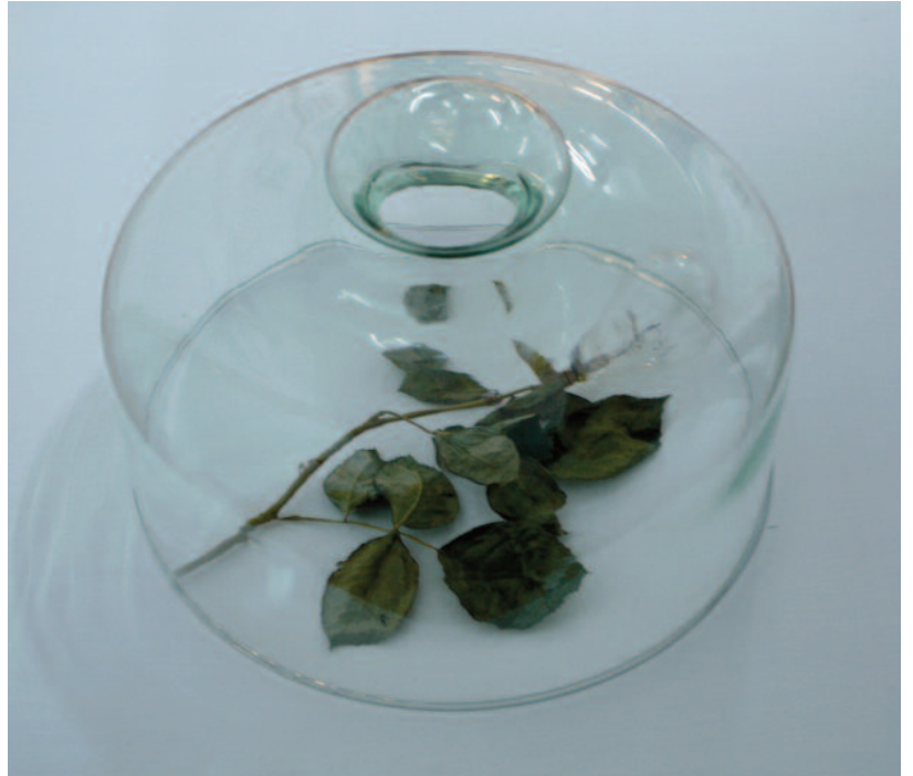
como una guirnalda escarlata rosa, bombilla y vidrio / 2009 |pieza única|