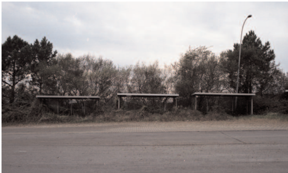
artxanda (o cómo salir de una ciudad andando)