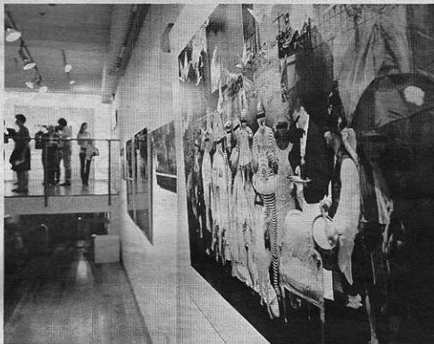
La muestra tiene en la fotografía uno de sus elementos fundamentales

La exposición presente ofrece veinticuatro fotografías de color intervenidas todas digitalmente -en edición de tres unidades firmadas y numeradas- (aunque se den en esas fotos ciertos negros, a ninguna falta el color). Y su formato es generalmente gran-