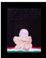
Lettera a Bxl