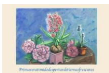
Primavera tímidos despertar de tiernas frescuras