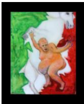
Il Cavaliere senza cavallo

2 cuadros (2 están dañados) en técnica mixta, sujeto humorístico, colores acrílicos sobre cartón entelado y madera - 40x40 cm.