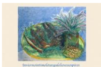
Invieron íntimo letargo delie veso spiros

4 Fotografías a colores en papel con sujetos obras propias en técnica mixta sobre tela con frase - 80x60 cm.