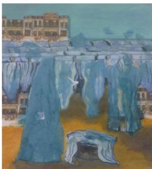
La Colada: lo importante es que no destiña - 2010

Obra en técnica mixta sobre papel. 72x55 cm – Colección Aires de Córdoba