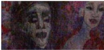
Vestido de Mujer - 107 x 87cm

3 Collages sobre patrones de vestido de mujer, técnica mixta, colores acrílicos y patrón en tela sobre papel de diseño, con gancho de ropa en madera - medidas varias.