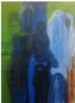
Funda[mental]izándose: Ella, yo y lo otro - 2010

Obra en técnica mixta sobre papel. 72x55 cm – Colección Aires de Córdoba