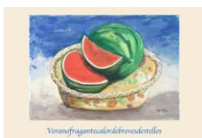
Verano fragante calor de breves destellos