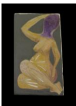
Europa ponte guapa