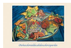
Otoño colonial de cálidos colores pardos