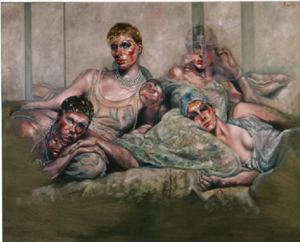
Fashion IV, 2005.

El mundo es complejo. La imagen que de el tenemos (la que se nos quiere mostrar) y esto incluye a las modelos de pasarela, a la moda, al "glamour" es cuanto menos unilateral por no decir falsa. Para mi La Belleza es otra cosa, algo así como un Aleph (que diría Borges) donde confluyen la sensualidad con la sordidez, la fineza con el grotesco, la vida con la muerte... Como decía en otra pregunta yo no quiero contar nada. El lenguaje pictórico dice y expresa cosas que no pueden ser dichas de otra manera.