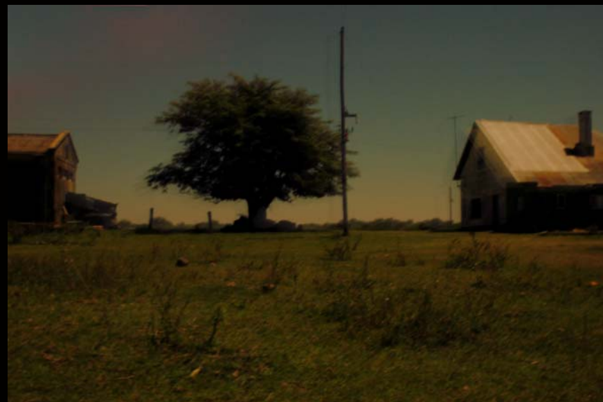
"Silencio" - 2006 - Impresión Lambda sobre papel RC - 30 x 40 cm.