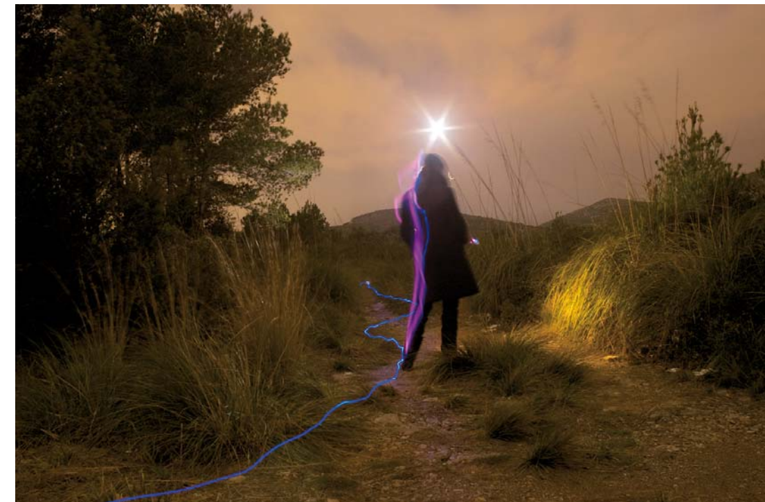
"Tiempo + Espacio = Tú" - 2008 - Impresión Lambda sobre papel RC. 50 x 70 cm.