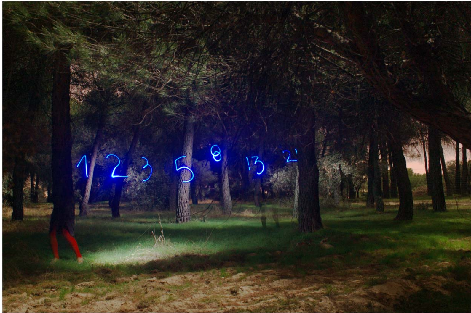
"Fibonacci" - de la serie Control - 2007 - Impresión Lambda sobre papel RC - 140 x 95 cm.