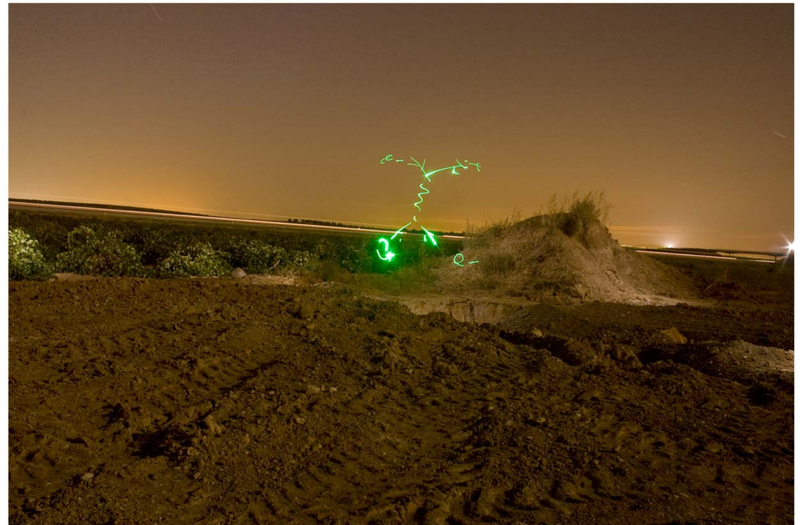
"Richard Feynman's diagram" - de la serie Control - 2008 - Impresión Lambda sobre papel RC - 140 x 95 cm.