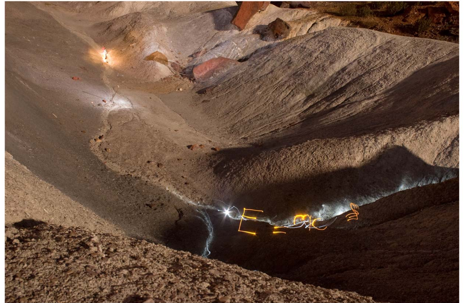
" E=mc^2 " - de la serie Control - 2008 - Impresión Lambda sobre papel RC - 140 x 95 cm.