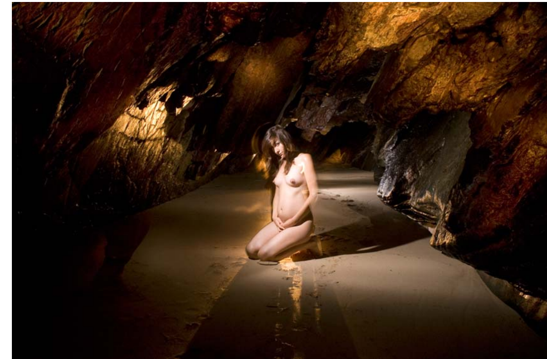
"In Utero" - 2009 - Impresión Lambda sobre papel RC - 50 x 70 cm.