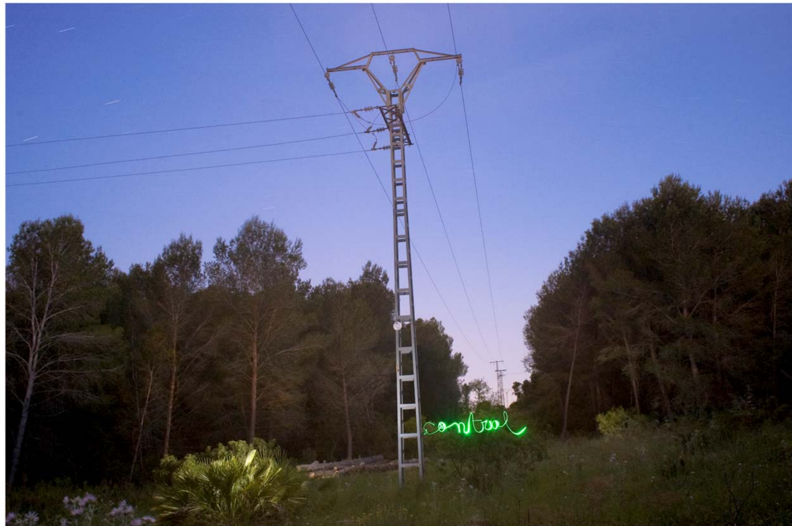
"Control" - de la serie Control - 2009 - Impresión Lambda sobre papel RC - 140 x 95 cm.