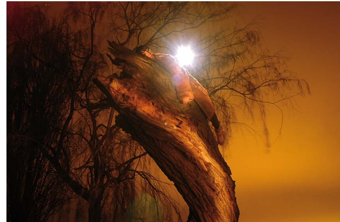
"Squire-I" - 2009 - Impresión Lambda sobre papel RC - 50 x 70 cm.