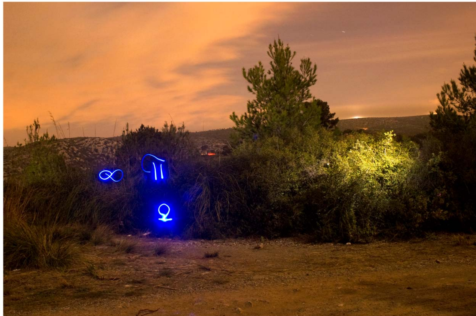
" \pi, \infty, \Omega " - de la serie Control - 2008 - Impresión Lambda sobre papel RC - 140 x 95 cm.