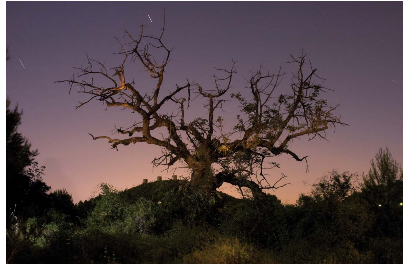
"El 'arbol de la vida" - 2009 - Impresión Lambda sobre papel RC - 140 x 95 cm.

-Lowe Lintas --- Mumbai, India. -Mauro Rossi Collection --- Brescia, Italia www.mrcollection.it