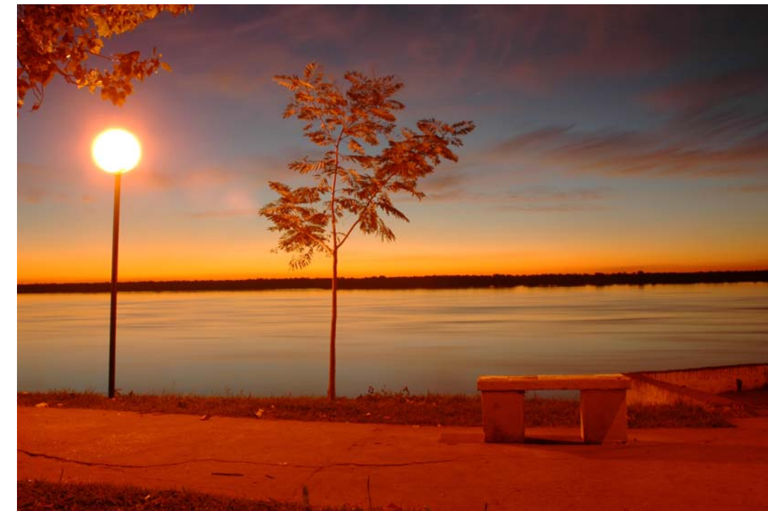
"La espera" - 2006 - Impresión Lambda sobre papel RC - 30 x 40 cm.