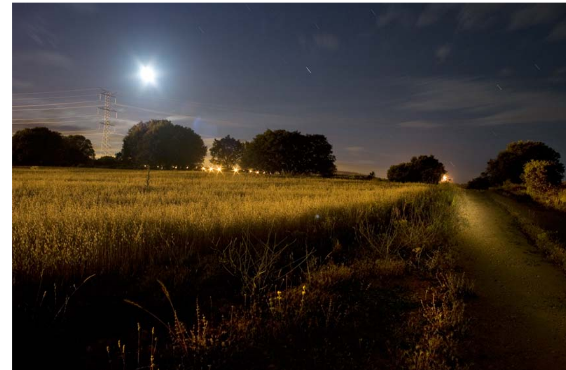
"Sendero" - 2009 - Impresión Lambda sobre papel RC - 50 x 70 cm.