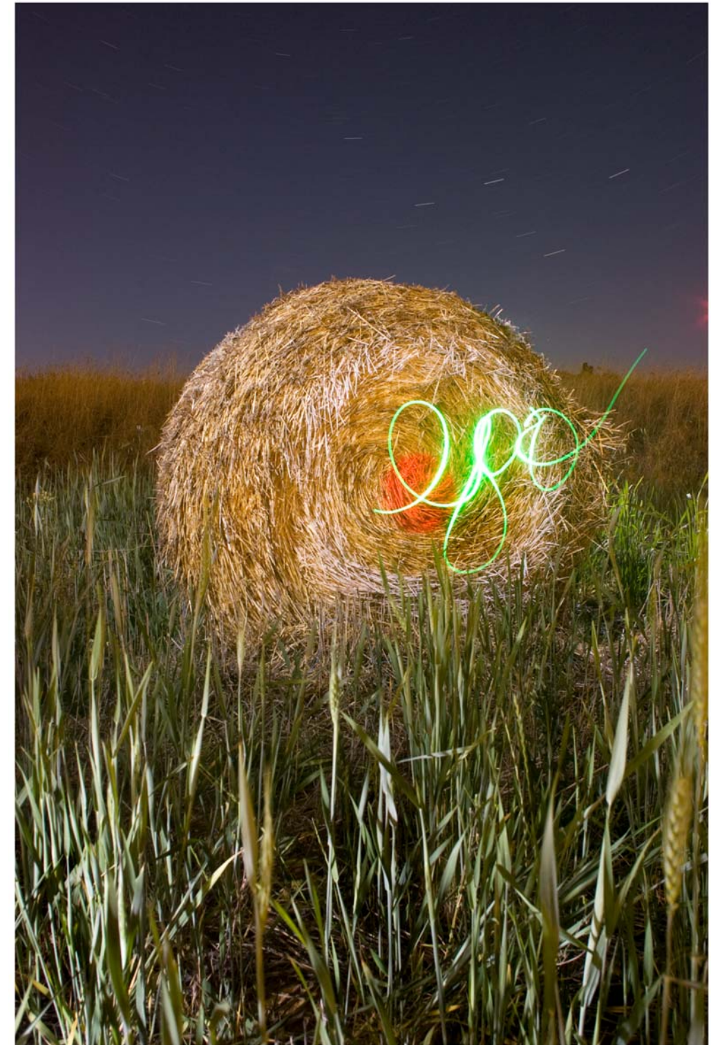
"Zen" - de la serie Control - 2009 - Impresión Lambda sobre papel RC - 140 x 95 cm.