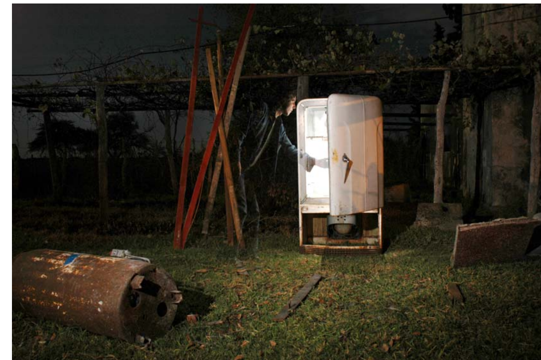
"Vacío (Mi mente)" - 2006 - Impresión Lambda sobre papel RC - 30 x 40 cm.