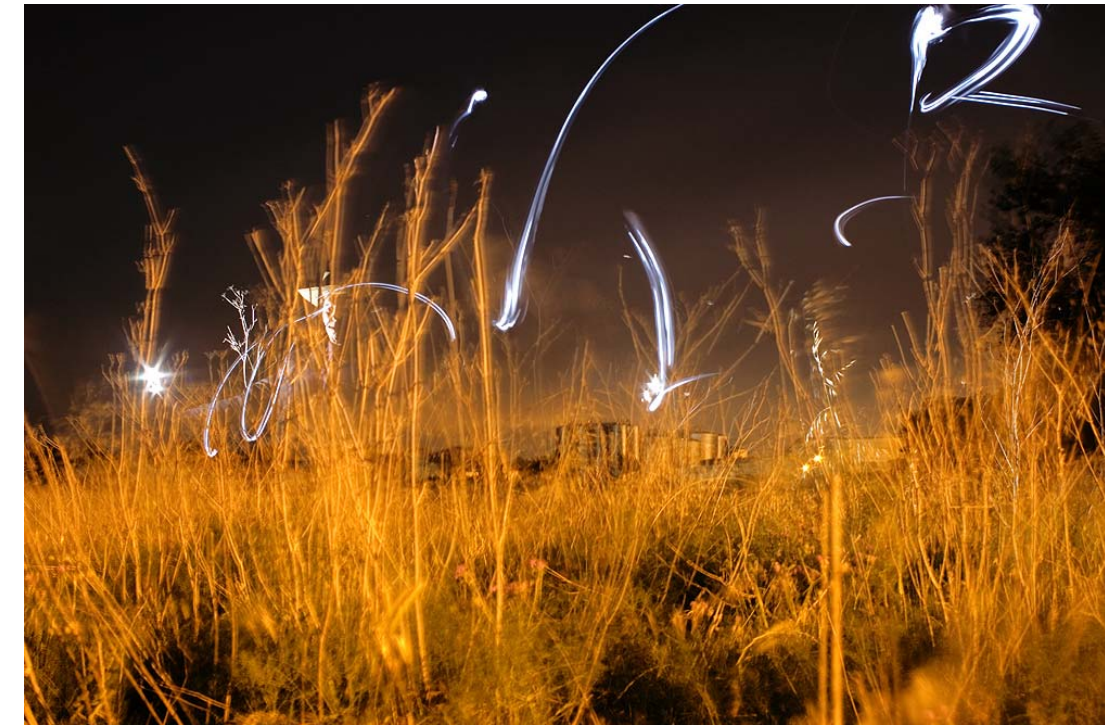
"Van Gogh vs. el Sueño de Akira Kurosawa" - 2007 - Impresión Lambda - 50 x 70 cm.