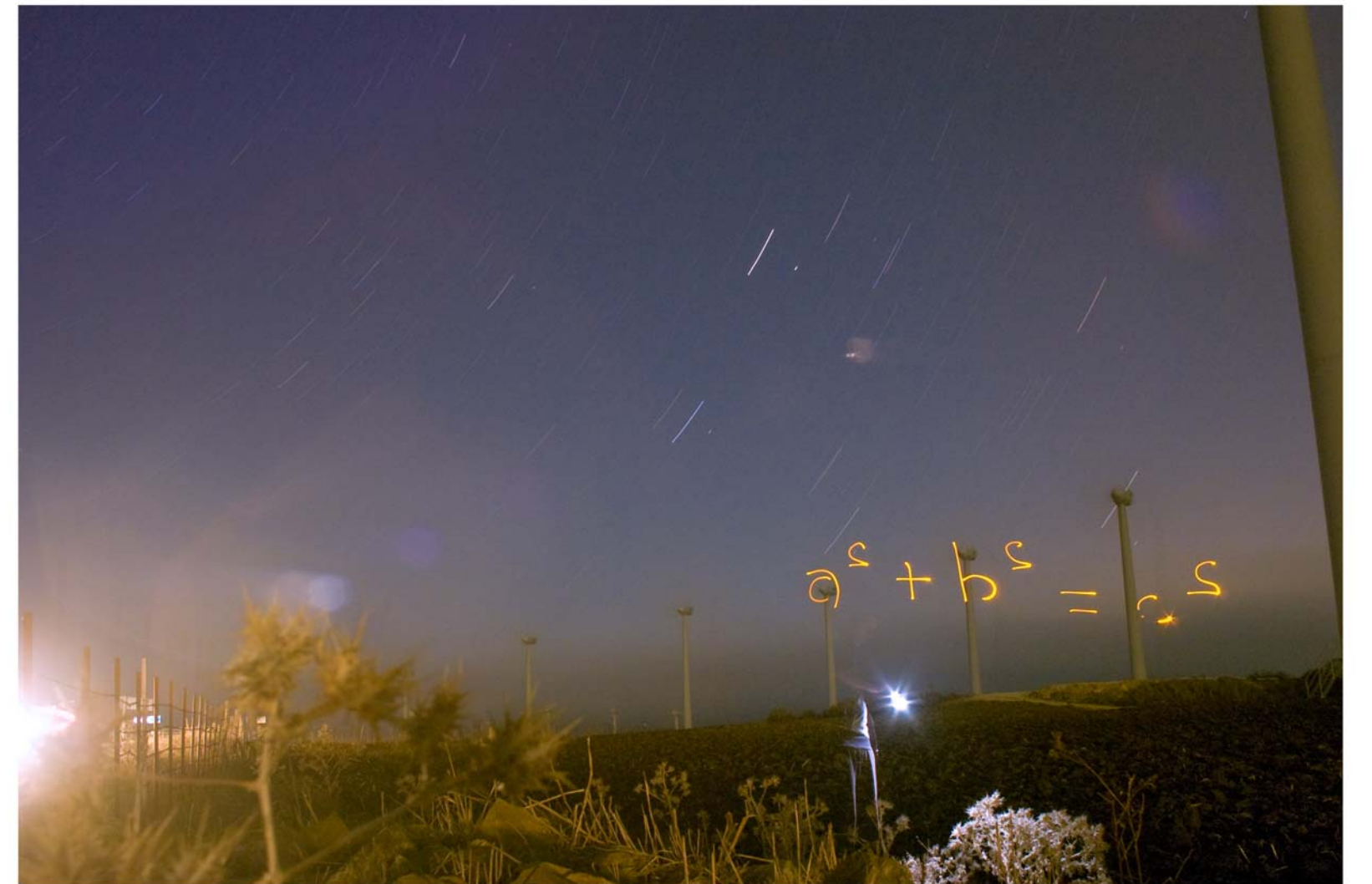
" a^2 + b^2 = c^2 " - de la serie Control - 2008 - Impresión Lambda sobre papel RC - 140 x 95 cm.