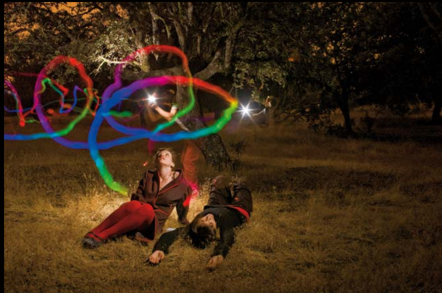
"Baño de luna en la hierba" - 2008 - Impresión Lambda sobre papel RC - 50 x 70 cm.