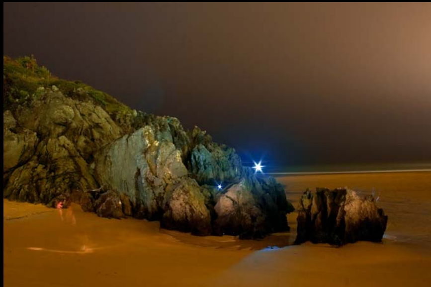
"Robinson Crusoe" - 2007 - Impresión Lambda sobre papel RC - 30 x 40 cm.