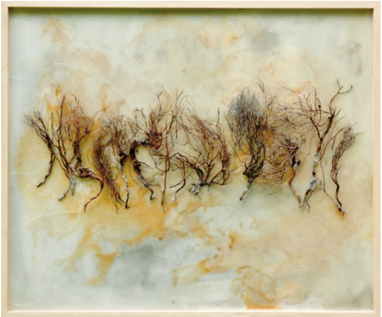
Poetica de nebulosas 100 x 120 cm - Técnica mixta