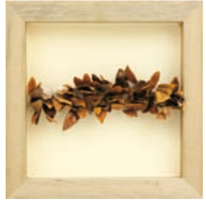
Orgánico 30 x 30 cm (unidad) - Técnica mixta