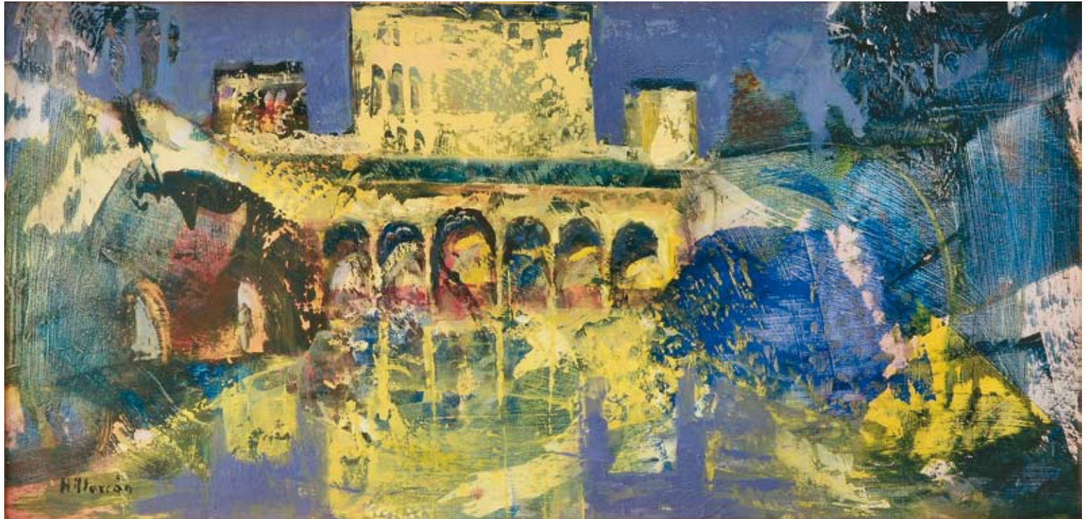
La Alhambra 30 x 60 cm