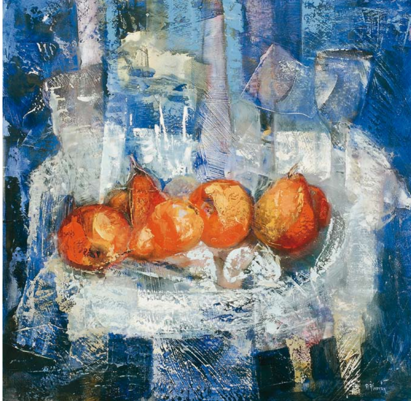
Frutos rojos sobre azul 70 x 70 cm