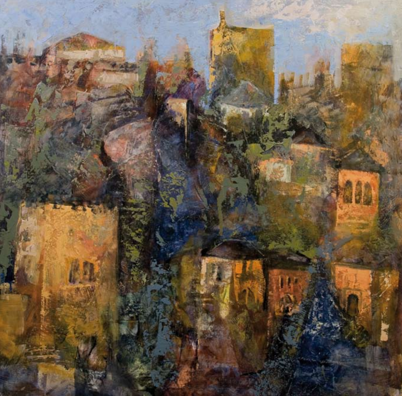
Palacios Nazaries 90 x 90 cm