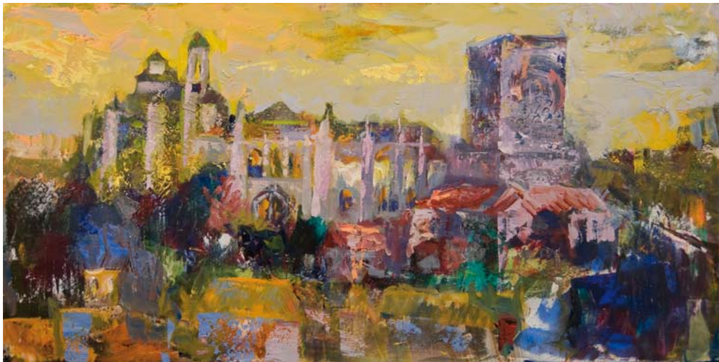
Luz malva en La Catedral de Granada 40 x 80 cm