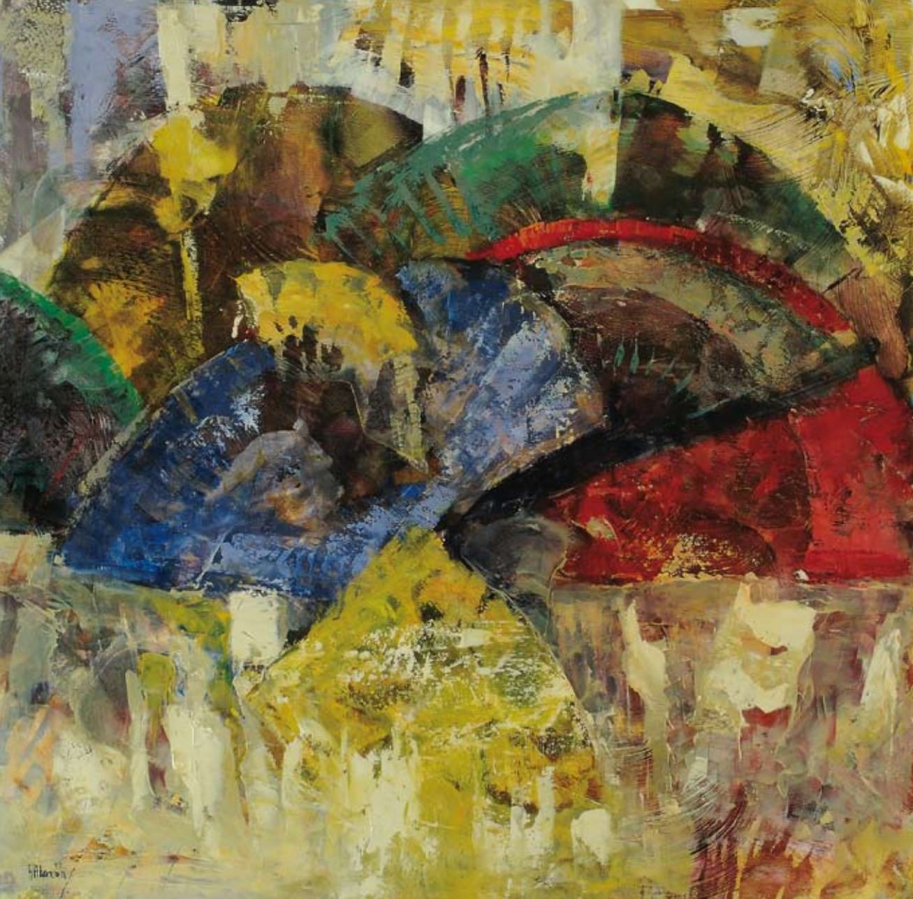
Siete abanicos 90 x 90 cm