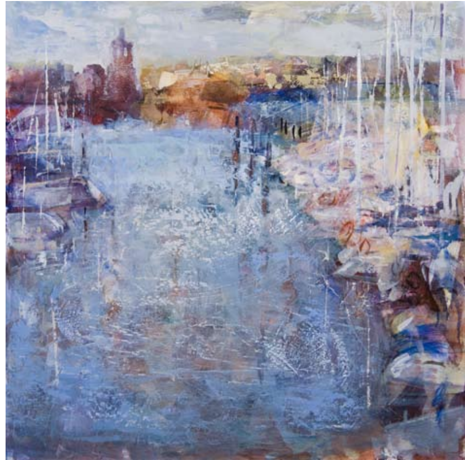
Puerto deportivo II 70 x 70 cm

Y rompo el ancla en pedazos Y voy detrás de tu barca Derivando. Que si la vida es remar ... ¡Yo quiero seguir remando!