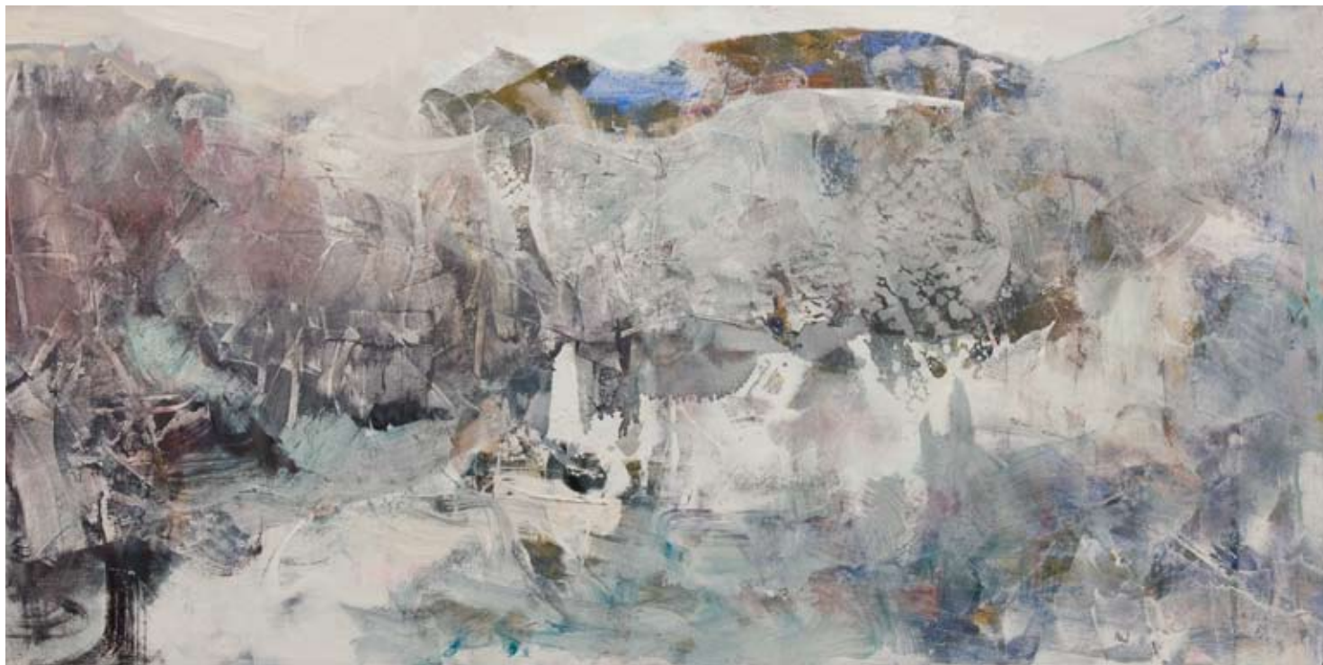
Nevando en Capileira 40 x 80 cm