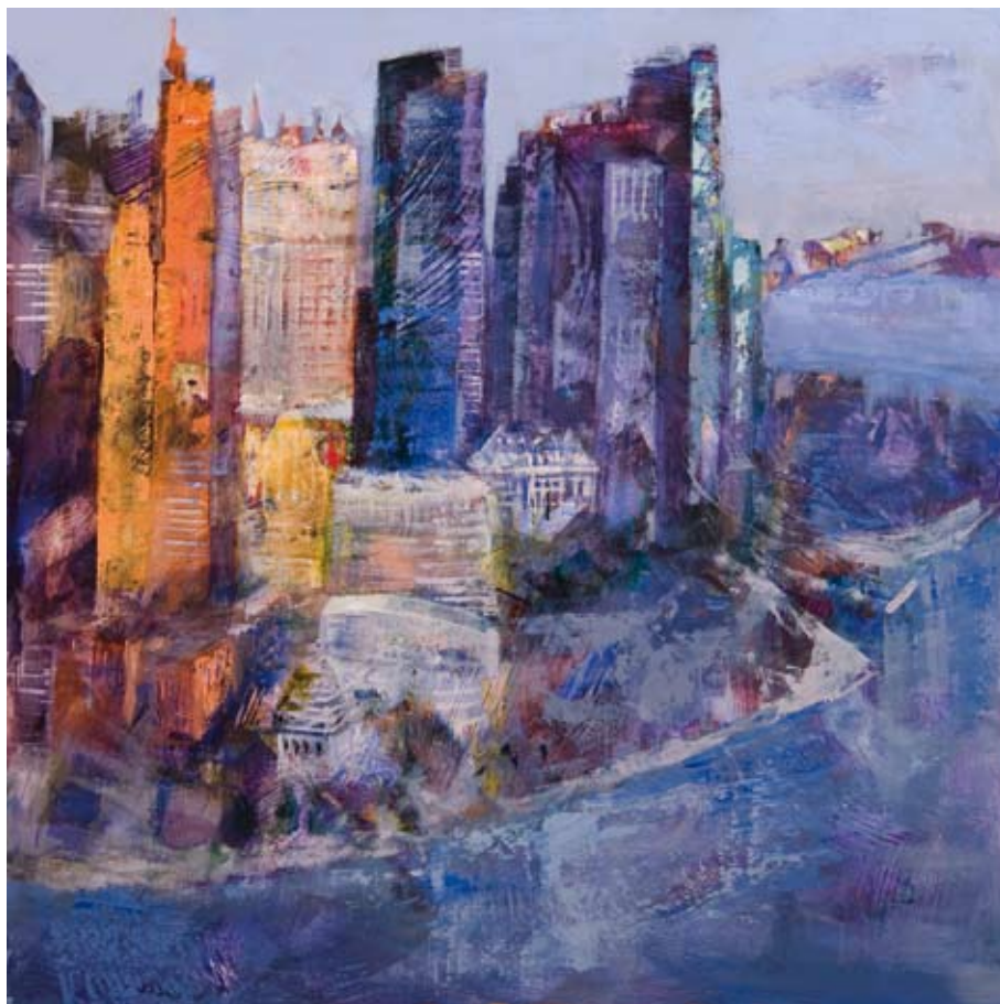
Luz azul en Manhattan 70 x 70 cm