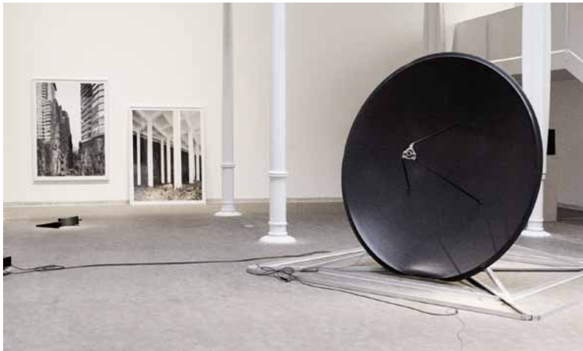
En el primer cercle. Un projecte d'Imogen Stidworthy. © Imogen Stidworthy, 2012. Publicat sota llicència CC BY-NC-SA.