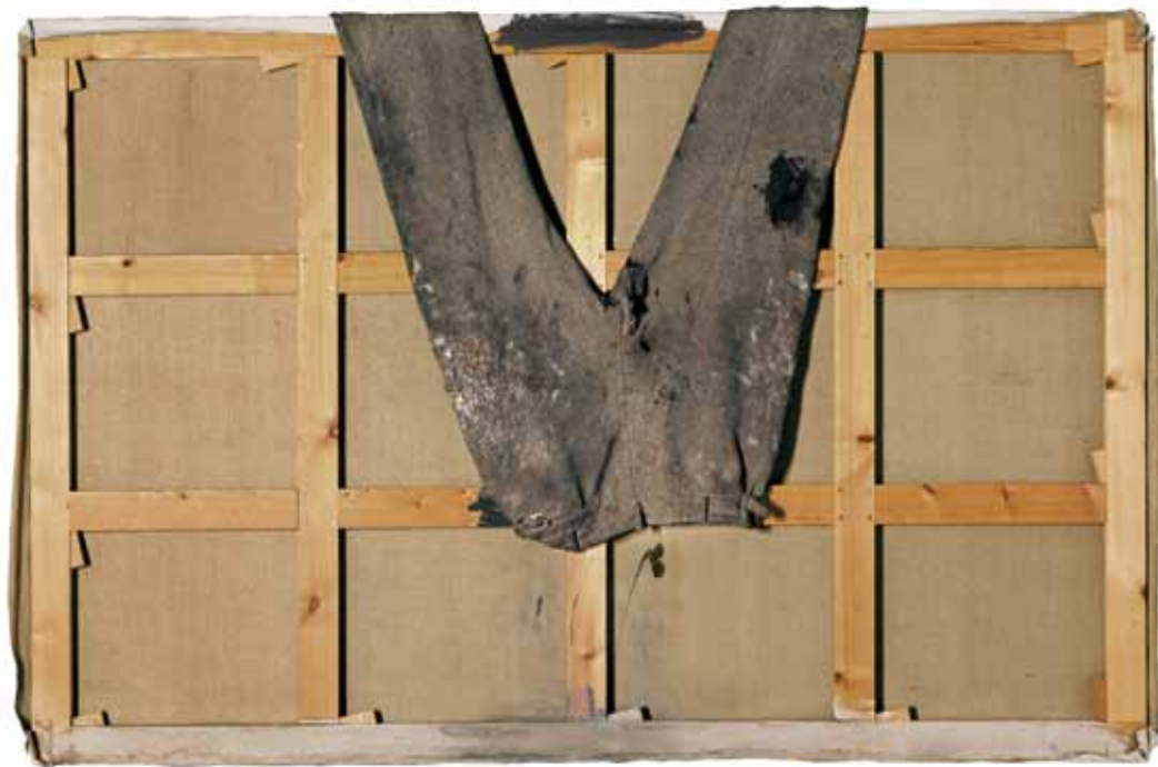
Antoni Tàpies, Pantalons sobre bastidor , 1971 © Fundació Antoni Tàpies / VEGAP, 2012.