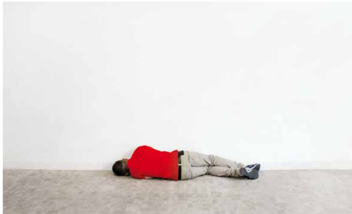
© Xavier Le Roy, 2012. Fotografia: Albert Ibanyez, 2012. © Fundació Antoni Tàpies, 2012. Publicat sota llicència CC BY-NC-SA.

Organització: Fundació Antoni Tàpies i Mercat de les Flors, amb la col·laboració de Le Kwatt i el Museu d'Art Contemporani de Barcelona (MACBA), i el suport del Goethe-Institut Barcelona i de l'Institut Francès de Barcelona, del Ministeri d'Assumptes Exteriors d'Alemanya i del Consulat General d'Alemanya a Barcelona. | Calendari: del divendres 24 de febrer fins el diumenge 22 d'abril de 2012. | Preu: 7 €. Estudiants i jubilats, 5,60 €. Nens i nenes, joves fins a 16 anys,