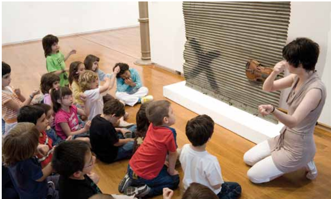
Activitat per a nens i nenes.