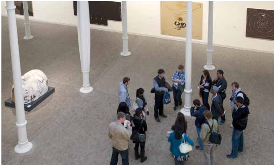
Vista de l'exposició Antoni Tàpies. Els llocs de l'art . Fotografia: Lluís Bover, 2012. © Fundació Antoni Tàpies, 2012. Publicat sota llicència CC BY-NC-SA.