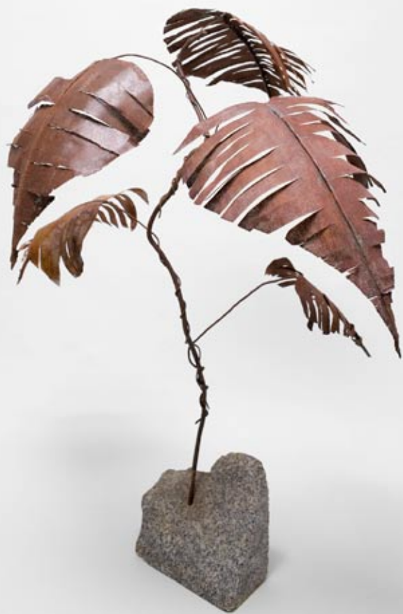
Poto 75 X 50 X 60 cm Granito, alambre, malla de cobre de pantalla TV.