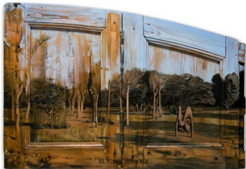
El final de un día Óleo sobre madera 45,5 x 67,4 x 4 cm