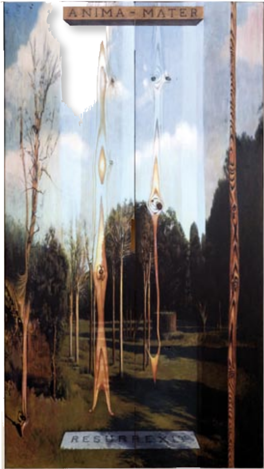
Resurrexit Óleo sobre madera 144 x 81,5 x 4 cm