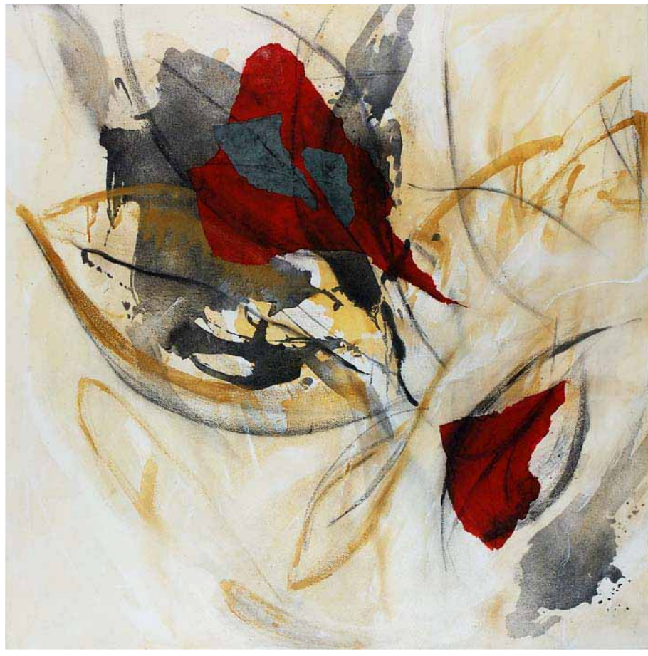
Naturaleza roja · Acryl auf Leinwand · 100 x 100 cm · 2006