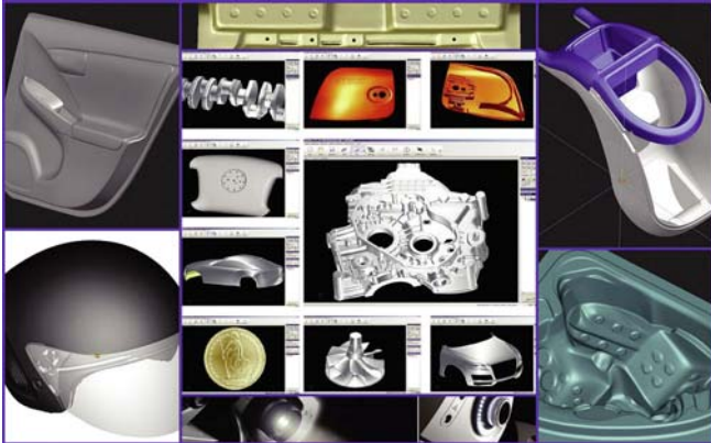
Incorporación de la última Tecnología en Digitalizado 3D Nuevo Scanner Comet 5 2M