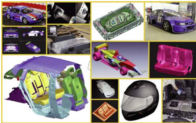
Automoción: El sector mas profesional y exigente