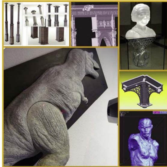
Experiencia en Arte y Patrimonio