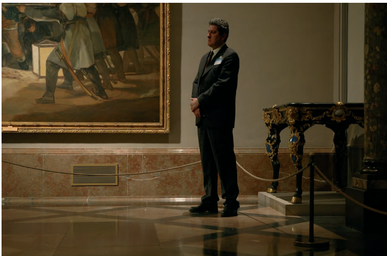
'Aportación de vigilancia al Museo del Prado'. Vigilar al vigilante de la sala 39.

'Contribution of Watchfulness to Prado Museum'. Watching the Watcher of Room 39.