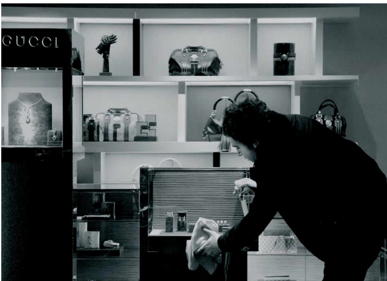
'Aportación de trabajo gratuito al Grupo Gucci'. Las vitrinas de una boutique de Gucci fueron limpiadas sin recibir a cambio remuneración alguna. 'Contribution of Free Work for Gucci Group'. The Vitrines of a Gucci Boutique Were Cleaned Without any Remuneration Being Paid.