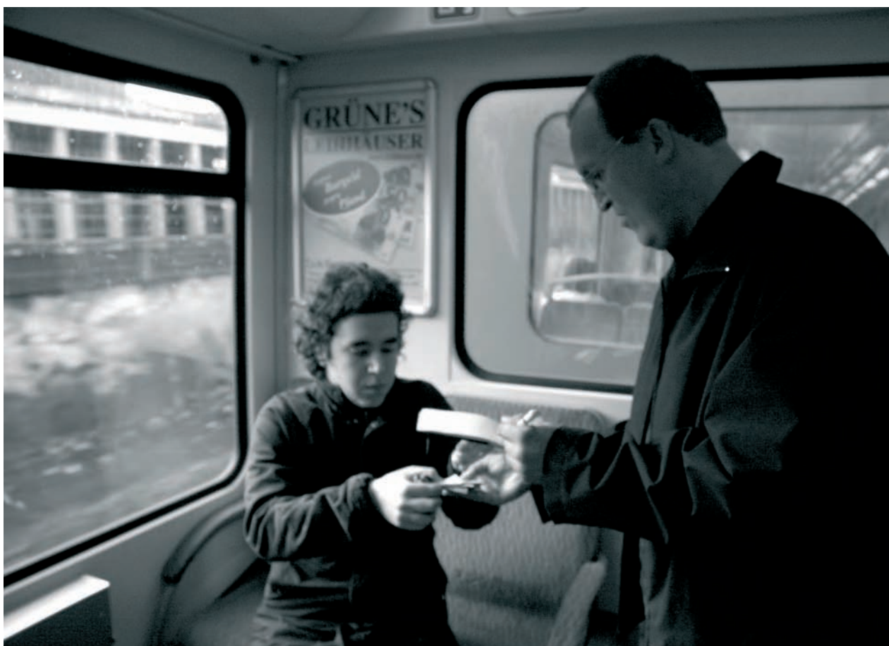
'Propina'. Se abonó con dinero público la multa impuesta por viajar sin billete válido y se obsequió al inspector de la línea 1 del U-Bahn de Hamburgo con una bonificación del 10% sobre el precio de la sanción. / 'Tip'. The inspector of the Line 1 Hamburg U-Bahn Was Paid With Public Money the Amount Corresponding to the Fine Imposed for Travelling Without a Ticket Plus and Extra 10% of the Sanction with which he was presented as an economic bonus.