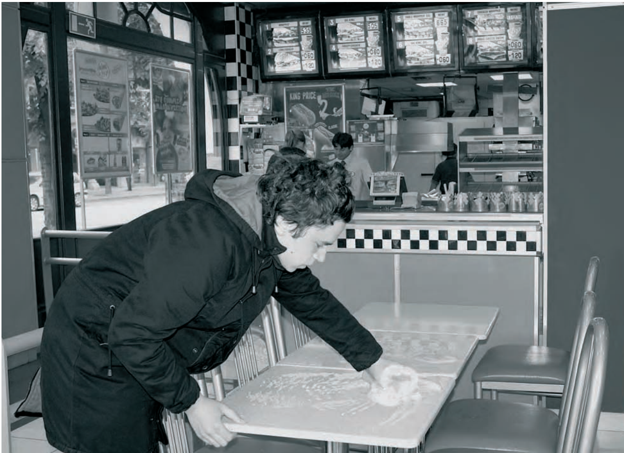
'Aportación de trabajo gratuito a Burger King Corporation'. Las mesas de un restaurante Burger King fueron limpiadas sin recibir a cambio remuneración alguna. 'Contribution of Free Work for Burger King Corporation'. Tables Located in a Burger King Restaurant Were Cleaned Without any Remuneration Being Paid.