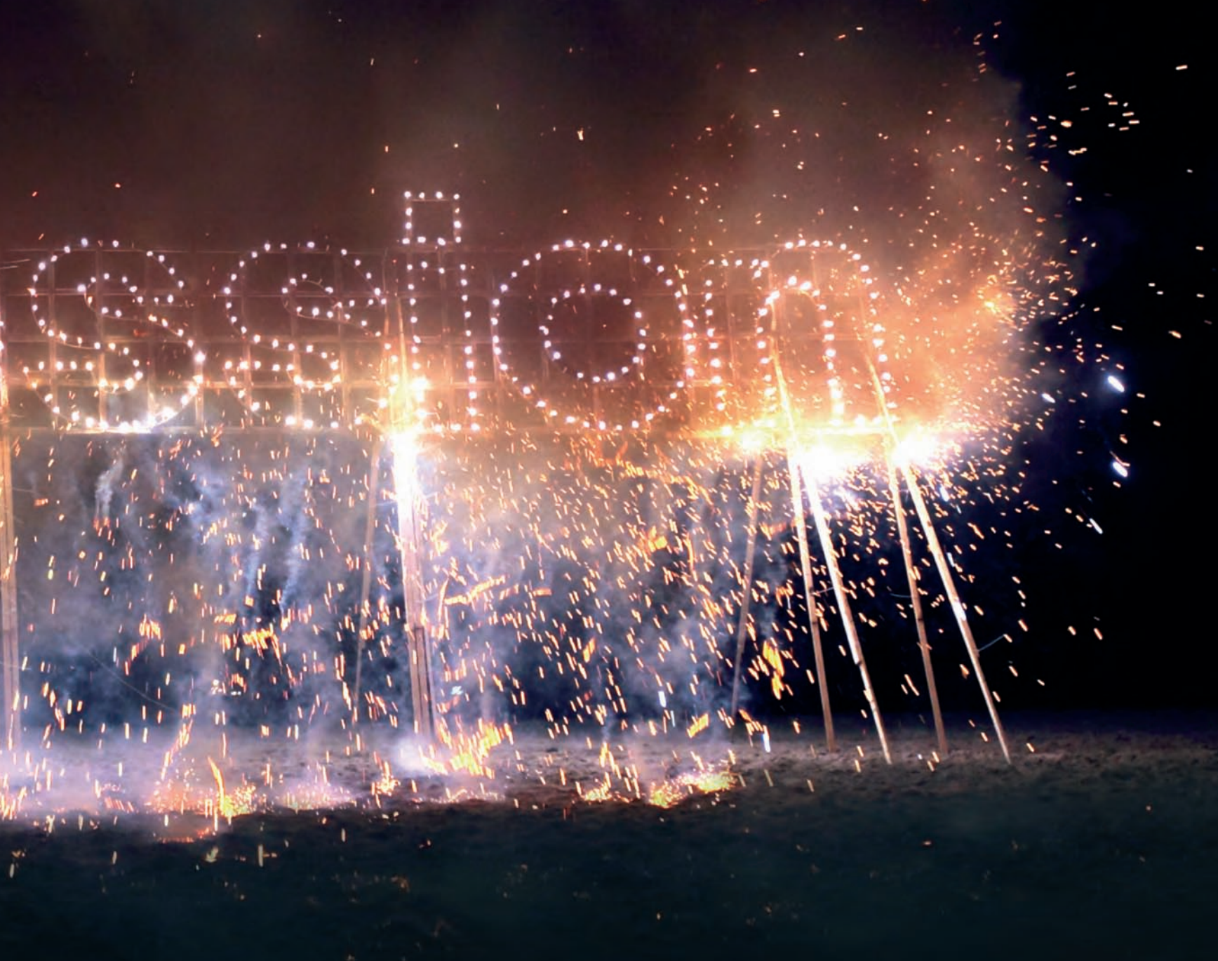
'La traca final'. Crédito bancario concedido a una galería de arte utilizado para lanzar fuegos artificiales en la clausura de Art Basel Miami Beach 2009. 'The Grand Finale'. Bank Loan Granted to an Art Gallery used to Pay a Firework Display at the Closing Ceremony of Art Basel Miami Beach 2009.

>> Con 'La traca final' has conseguido el premio ARCO 2010 y viendo lo que has hecho con tus anteriores subvenciones suponemos que con este dinero volverás a hacer lo imprevisible. Nos puedes adelantar algo.