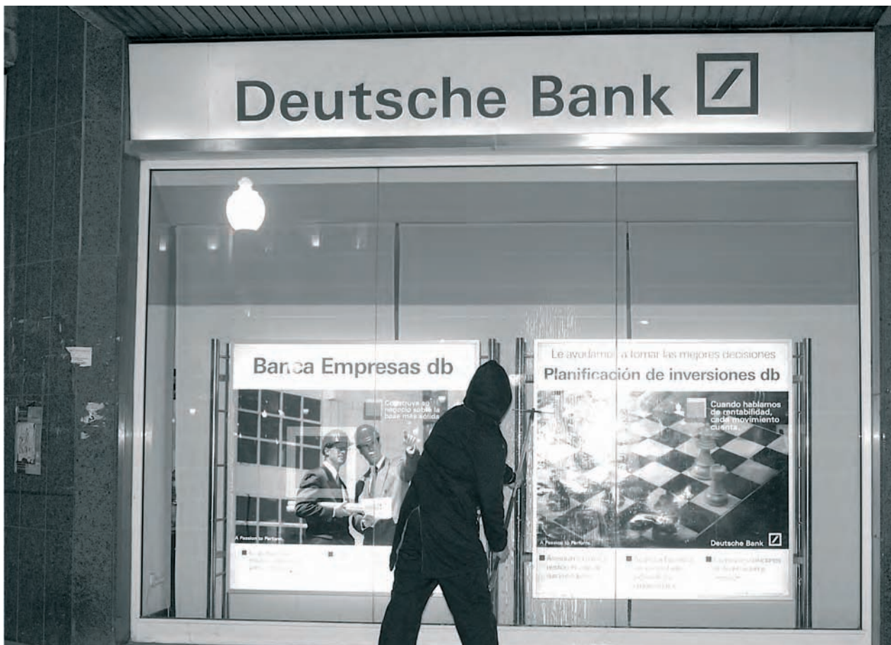
'Aportación de trabajo gratuito al Grupo Deutsche Bank'. Los cristales de una sucursal de Deutsche Bank fueron limpiados sin recibir a cambio remuneración alguna. 'Contribution of Free Work for Deutsche Bank Group'. Glasses of a Deutsche Bank Branch Were Cleaned Without any Remuneration Being Paid.