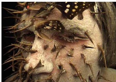
© Filippos Tsitsopoulos "Dov'è il mio ben"