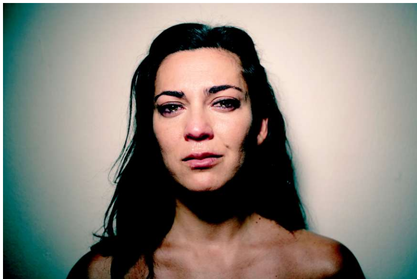
© Juanma Carrillo "To play at crying"